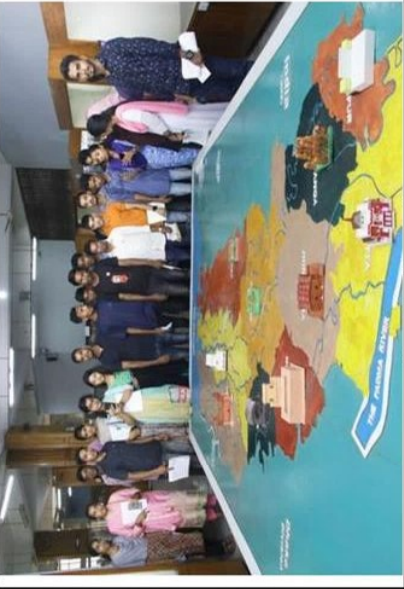
জাদুঘরের ১ নম্বর গ্যালারীতে বিভাগীয় মানচিত্রের মডেলের সামনে শিক্ষার্থীদের আলোকচিত্র