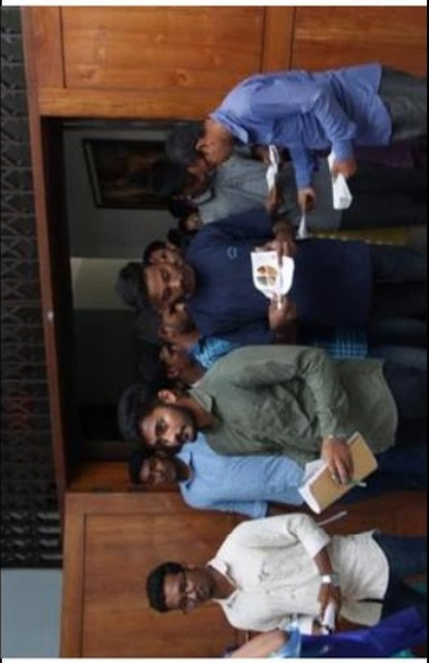
জাদুঘরের প্রদর্শনীর শুরুতে শিক্ষার্থীদের জাদুঘরের তথ্য সম্বলিত ইংরেজী ও বাংলা ব্লিশির প্রদান করা হয়