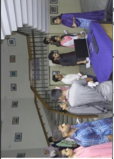
জাদুঘরের নিচলতার ইনোভেশন কর্ণারের সামনে শিক্ষার্থীরা