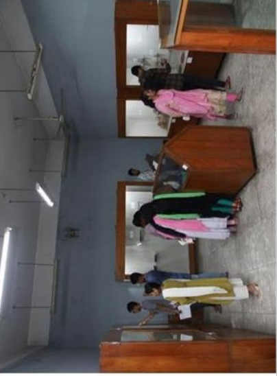
জাদুঘরের গ্যালারীতে শিক্ষার্থীদের আলোকচিত্র

এরপর শিক্ষার্থীবৃন্দ খুলনা বিভাগীয় জাদুঘরের প্রবেশ করেন এবং তাদেরকে খুলনা বিভাগীয় জাদুঘরের বাংলা এবং ইংরেজি ব্লিশিয়ার প্রদান করা হয়। যেখানে খুলনা বিভাগীয় জাদুঘরের বিস্তারিত বর্ণনা রয়েছে। এ পর্যায়ে শিক্ষার্থীবৃন্দকে খুলনা বিভাগীয় জাদুঘরের প্রদর্শিত সকল নিদর্শন যন্ত্র সহকারে দেখানো হয় এবং তাদের বিভিন্ন প্রশ্নের উত্তর দেওয়াসহ তথ্য প্রদান করা হয়। বিভিন্ন মুদ্রা এবং সময়কাল সম্পর্কে তাদের কৌতুহল মেটানো হয়। এছাড়া খুলনা বিভাগীয় জাদুঘরের মানচিত্রের উপর নব নির্মিত খুলনা অঞ্চলের দশটি মনুমেন্টাল নিদর্শনের মডেল সম্পর্কে ধারণা দেয়। শিক্ষার্থীবৃন্দ রাজা সীতা রাম রায়ের খাট দেখে আগ্রহ প্রকাশ করলে সেটা সম্পর্কে সঠিক তথ্য প্রদান করা হয়। বিভিন্ন কৃষ্ণ মূর্তি, শিব লিঙ্গ এবং দেব-দেবীর বাহন সম্পর্কে তাদেরকে তথ্য দেওয়া হয়।