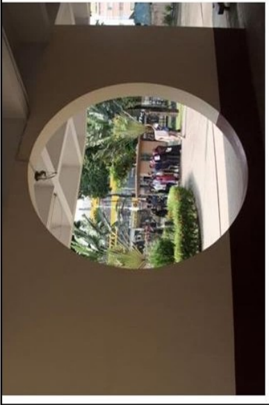
খুলনা বিভাগীয় জাদুঘরের প্রবেশকালীন শিক্ষার্থীদের আলোকচিত্র