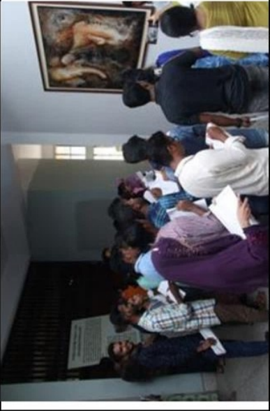
জাদুঘরের প্রদর্শনীর শুরুতে খনন ও উত্তলন সংক্রান্ত একটি তৈলচিত্রের সামনে শিক্ষার্থীদের আলোকচিত্র