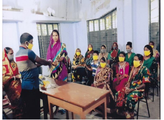
করোনাকালে ত্রাণ বিতরণ।