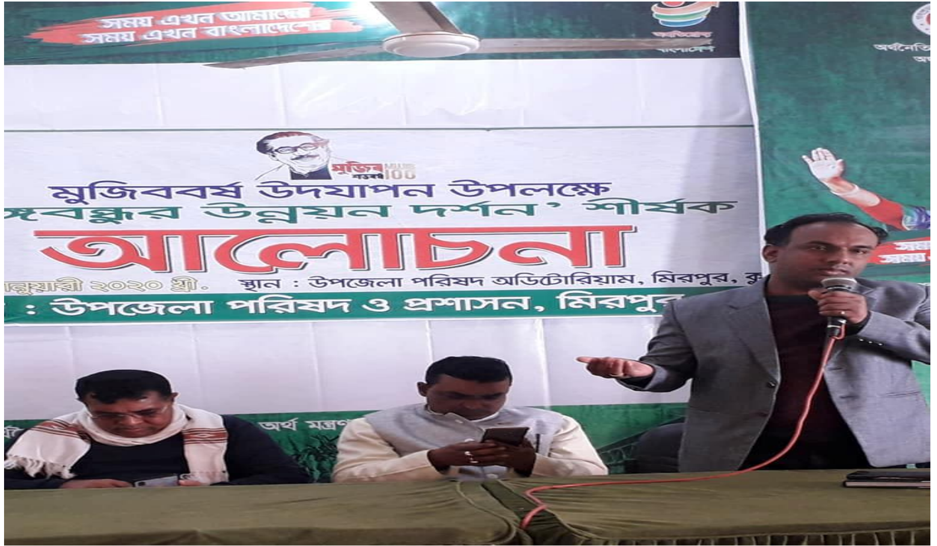
মুজিব শতবর্ষের ঞ্গগণনা উদ্বোধনসহ অন্যান্য কর্মসূচী আয়োজন। --মিরপুর, কুষ্টিয়া--