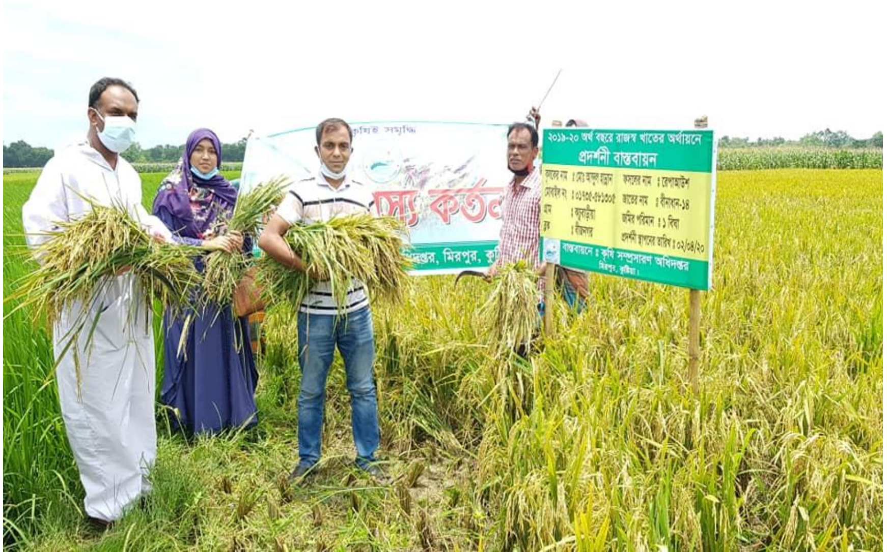
বিনাধান ১৪ জাতের নমুনা শস্য কর্তন