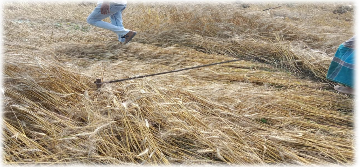
গম কর্তন এর প্রামাণ্য স্থির চিত্র