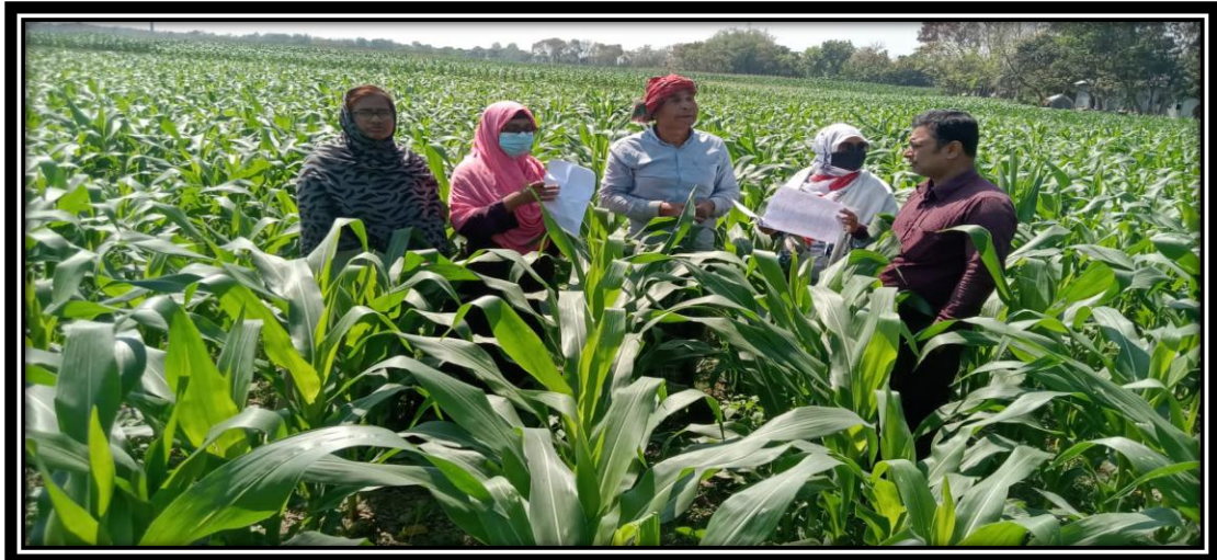
গম ও ভুট্টা ফসলের দাগগুচ্ছ জরিপ এর স্থির চিত্র