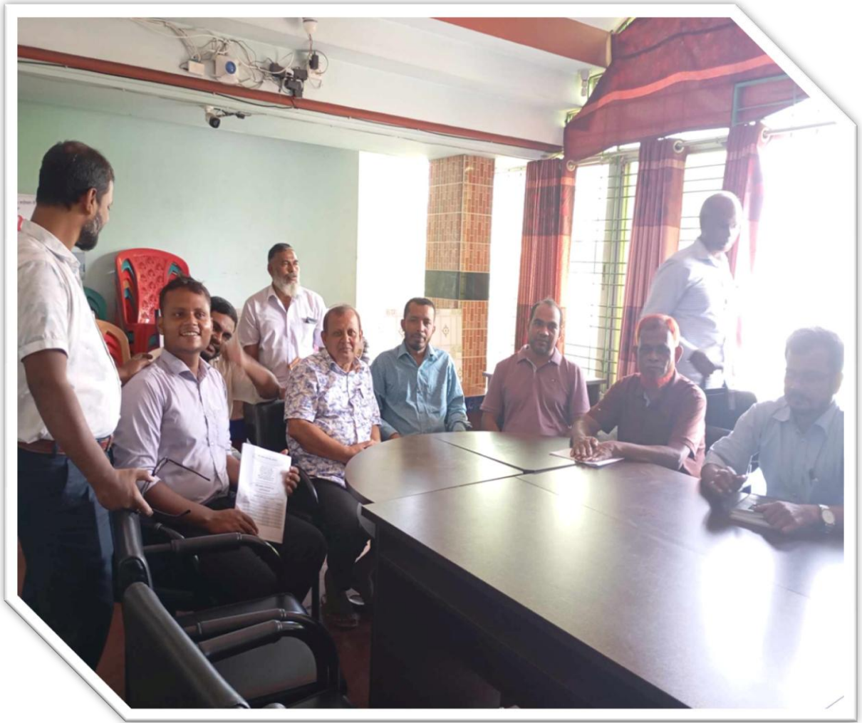
নৈতিকতা কমিটির স্থিরচিত্র