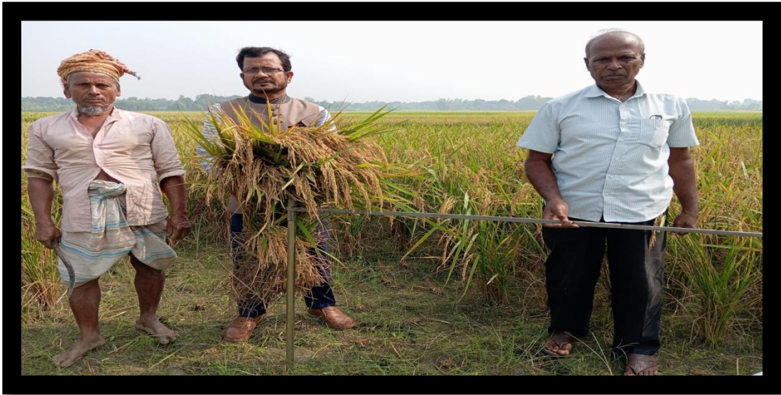
বোরো কর্তন এর প্রামাণ্য স্থির চিত্র