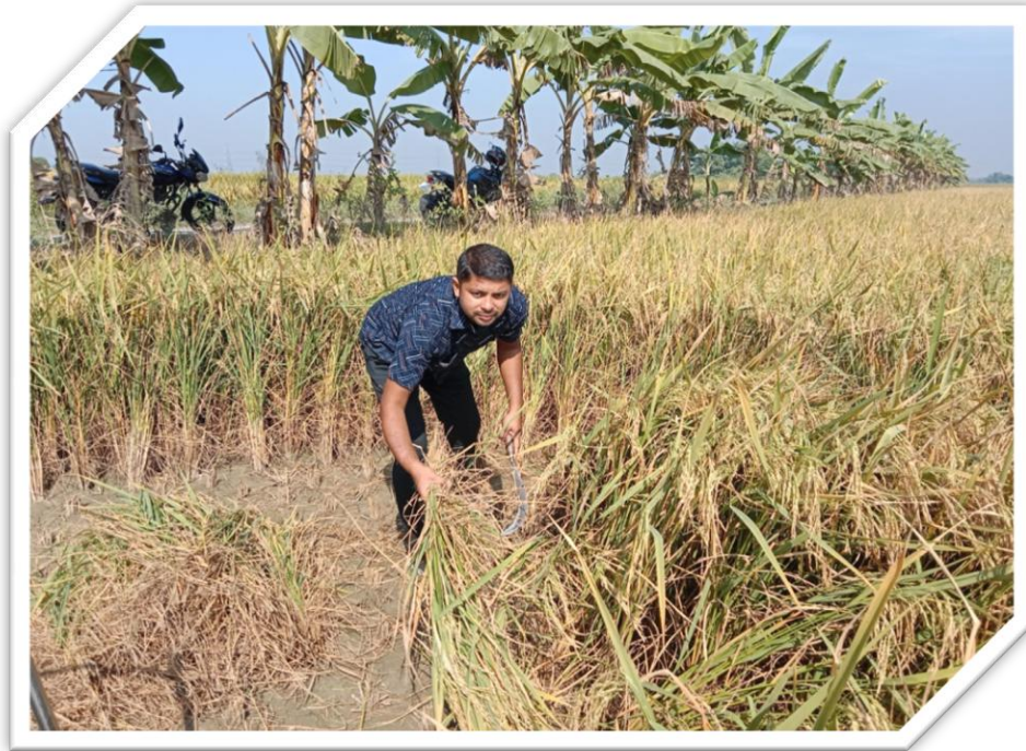
আমন কর্তন এর প্রামাণ্য স্থির চিত্র