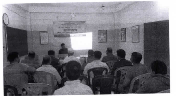
নিরাপদ খাদ্য বিষয়ে খাদ্যকর্মীদের প্রশিক্ষণ