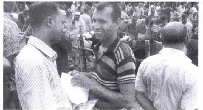
নিরাপদ খাদ্য বিষয়ক লিফলেট বিতরণ