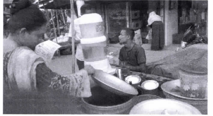
স্ট্রিট ফুড মনিটরিং