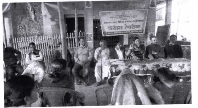
নিরাপদ খাদ্য বিষয়ক উঠান বৈঠক