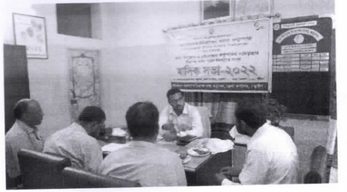
নিরাপদ খাদ্য পরিদর্শকদের সাথে মাসিক সভা